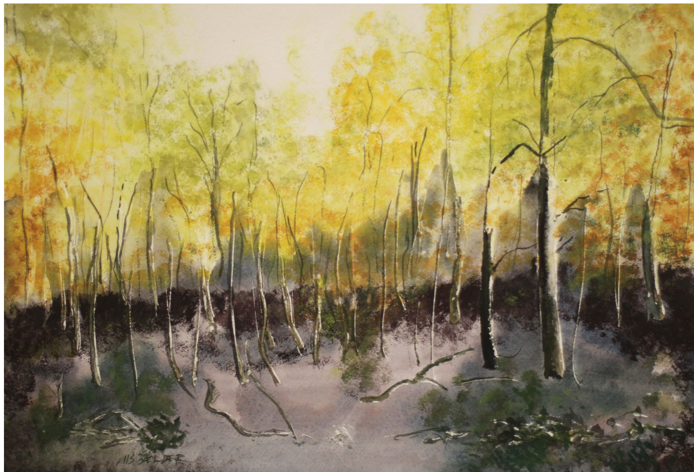
„ENNE ÖÖ SAABUMIST“