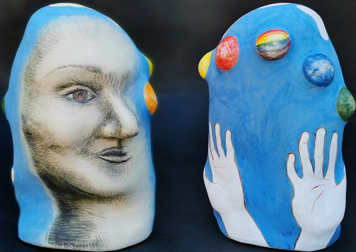
2019, plaaditehnika, kõrgkuumus, kõrgus 20 cm; juhendaja: Sergei Isupov 2019, slabbuilt, stoneware, height 20 cm; tutor: Sergei Isupov