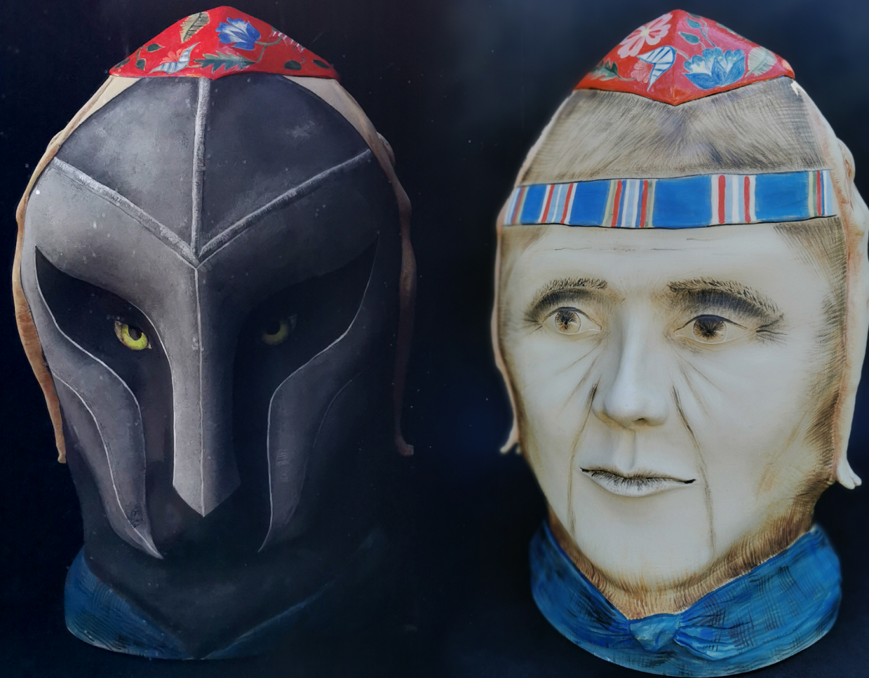
2019, plaaditehnika, kõrgkuumus, kõrgus 40 cm; juhendaja: Sergei Isupov 2019, slabbuilt, stoneware, height 40 cm; tutor: Sergei Isupov